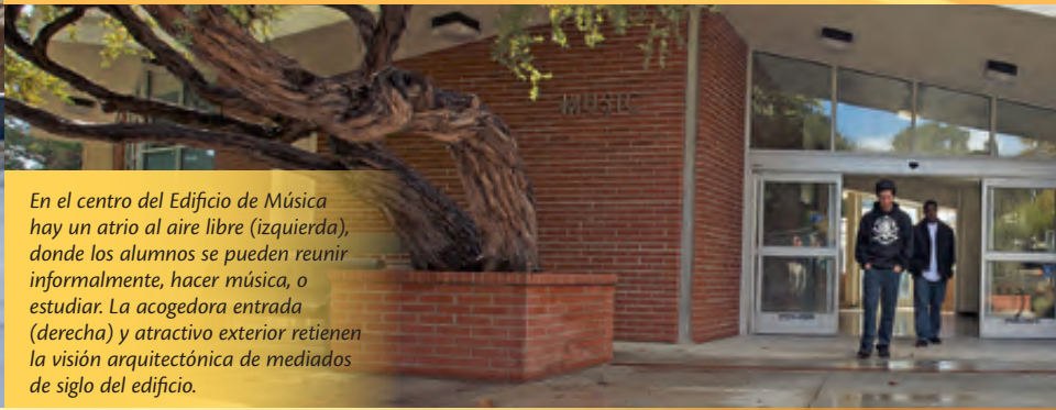
En el centro del Edificio de Música hay un atrio al aire libre (izquierda), donde los alumnos se pueden reunir informalmente, hacer música, o estudiar. La acogedora entrada (derecha) y atractivo exterior retienen la visión arquitectónica de mediados de siglo del edificio.