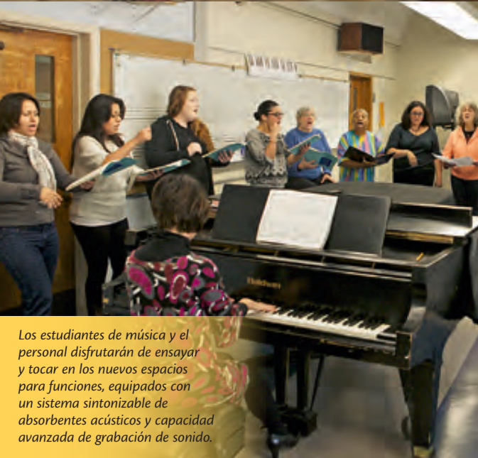
Los estudiantes de música y el personal disfrutarán de ensayar y tocar en los nuevos espacios para funciones, equipados con un sistema sintonizable de absorbentes acústicos y capacidad avanzada de grabación de sonido.

“No es a menudo que se le da a uno el regalo e increíble responsabilidad de crear algo que apoyará, ayudará, e inspirará a generaciones presentes y futuras.”