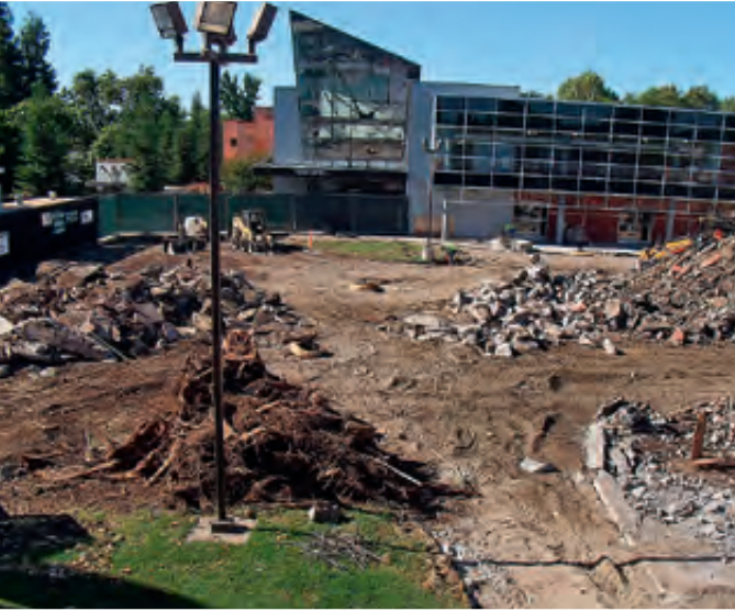
Arriba: Demolición de la antigua área del Cuadrilátero dio paso para el edificio de Centro de Servicios al Estudiante en Diablo Valley College, el cual alberga todos los servicios de apoyo al estudiante. Debajo: Proyecto de construcción del área de Enfermería en Los Medanos College trajo nueva tecnología a este muy cotizado programa.