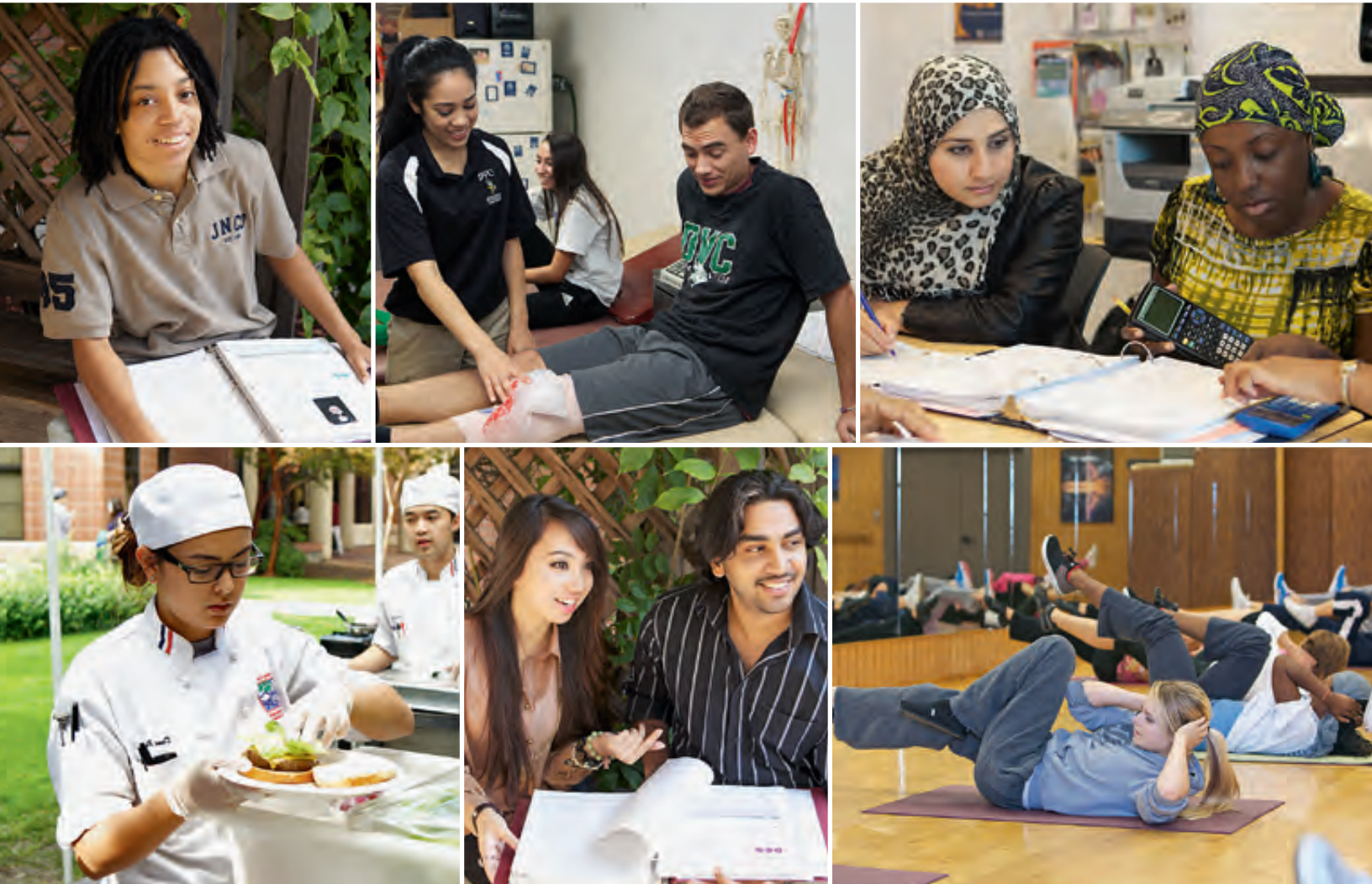
Estudiantes en los terrenos del Distrito de Universidades Comunitarias de Contra Costa

500 Court Street Martinez, CA 94553 925.229.1000 www.4cd.edu